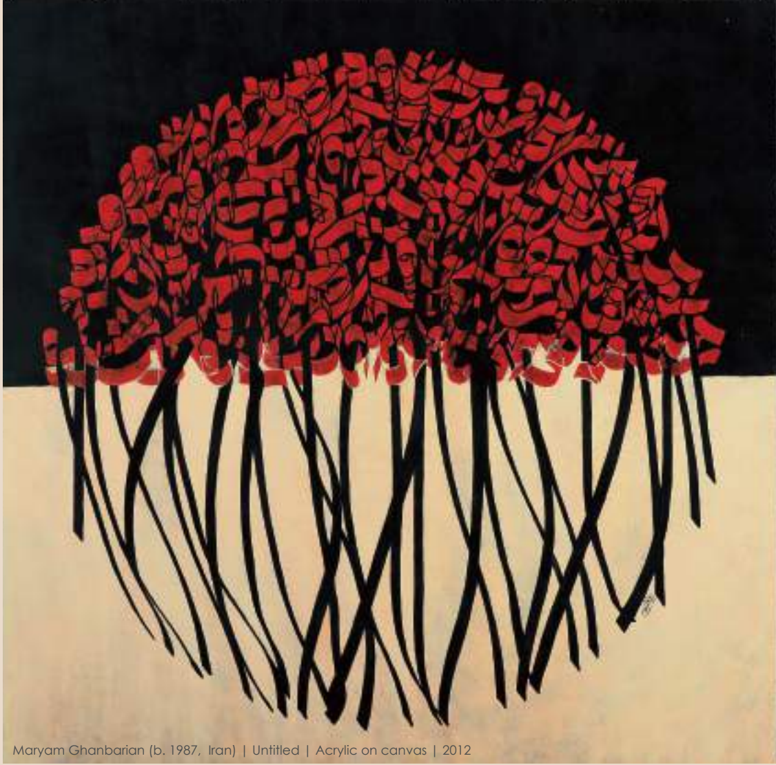
Maryam Ghanbarian (b. 1987, Iran) | Untitled | Acrylic on canvas | 2012