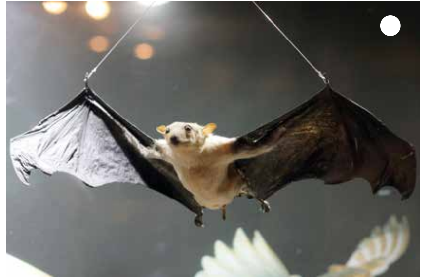
أتعرف على طائر الخفاش