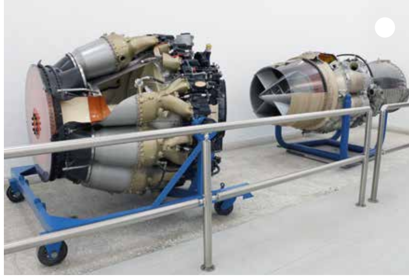
أشاهد محرك الطائرة