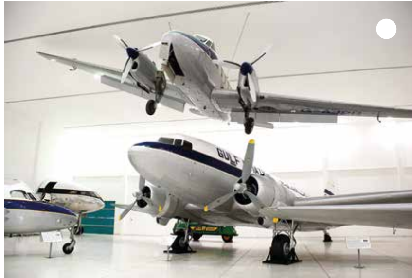
أشاهد الطائرات القديمة