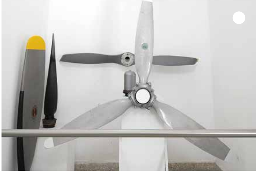
أشاهد مراوح الطائرة