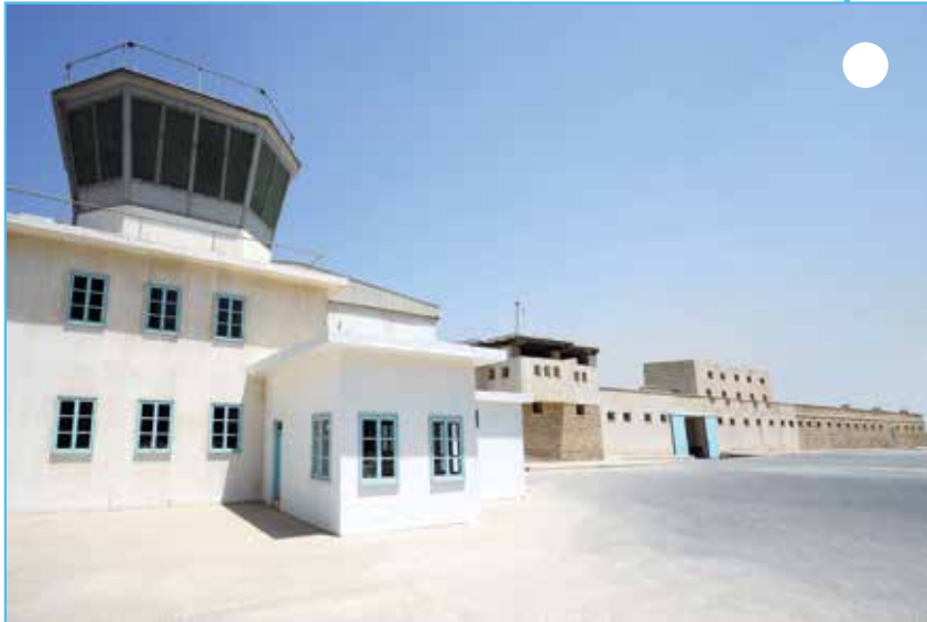
رحلة إلى متحف المحطة