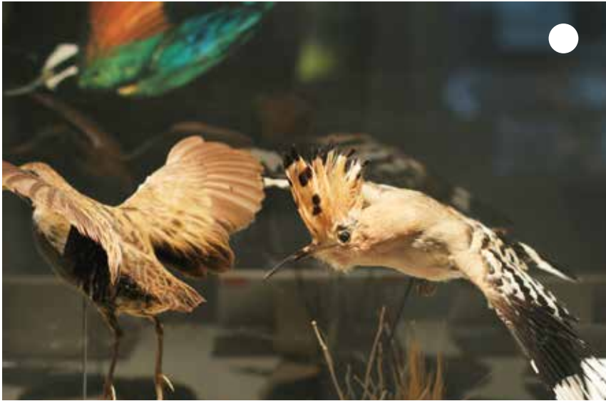
أتعرف على الطيور المختلفة