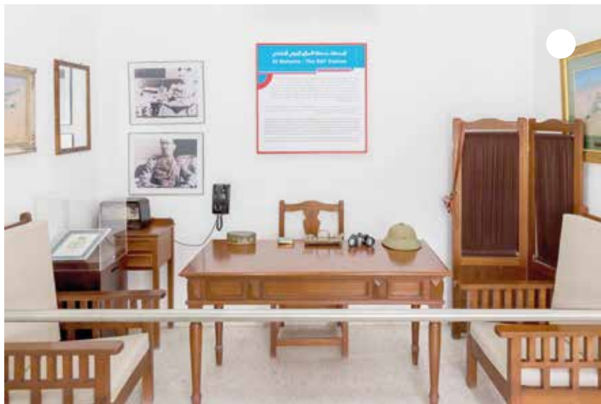
أتعرف على مكتب قائد الطيران