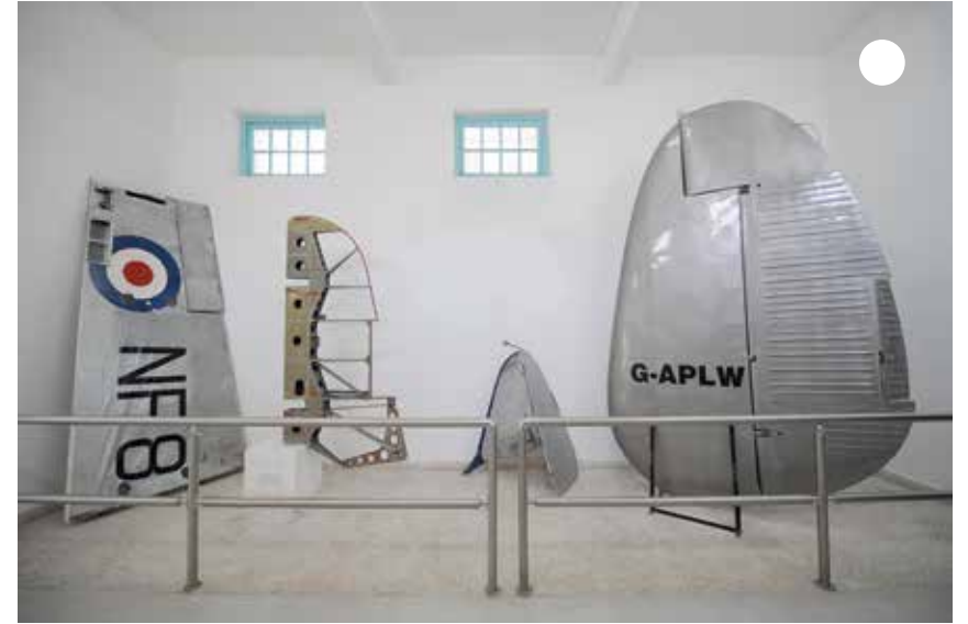
أتعرف على أجزاء الطائرة