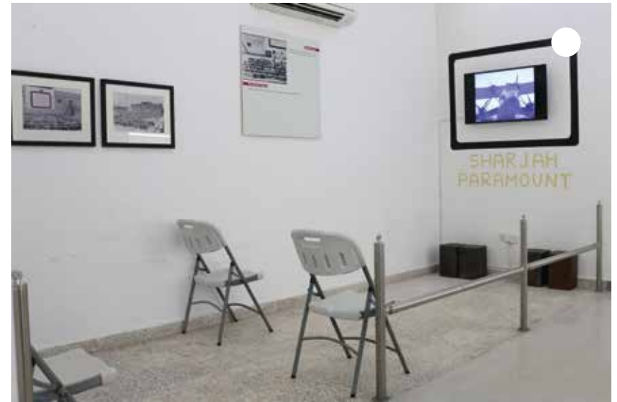
أتعرف على أول سينما في الخليج العربي