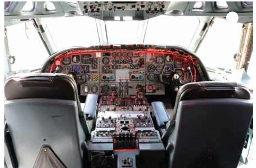
أتعرف على مقصورة القيادة