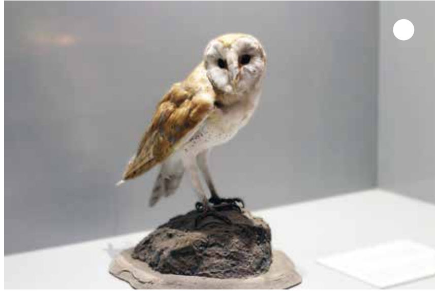
أتعرف على طائر البوم