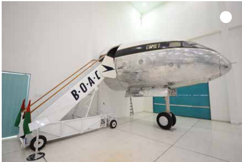
أصعد على الطائرة بحذر