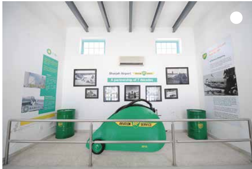
أتعرف على محطة وقود الطائرات